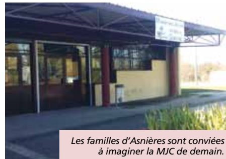
Les familles d'Asnières sont conviées à imaginer la MJC de demain.

> MJC - rue Pierre et Jane Boiteau - 18000 BOURGES - 02 48 70 06 98